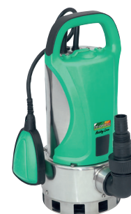
SX 1000 V HL

P1 1000 watt Q max. 300 l/min H max. 8,4 m